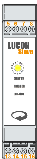
LUCON® 2 Slave